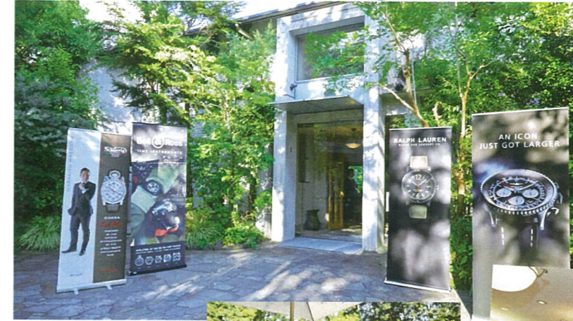
会場となった北野ガーデン