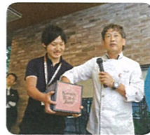
抽選で スペシャル賞品を ゲット!