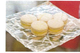
アイス・アンペリアルに合わせて作られた当日限定のマカロン