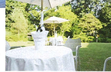
緑が映える北野ガーデンの庭園