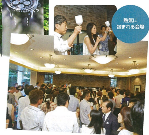
熱気に包まれる会場