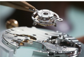
ムーブメントの開発と組み立て製造