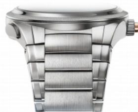
GMT ラトラバンテ 40mm 自動巻き パワーリザーブ 48 時間 60m 防水 SS ケース Pi950 ローレット加工ベゼル パーリーコンギョーシエを刻んだ ミラノブルー文字盤