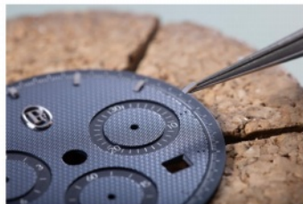
文字盤及び針の製造