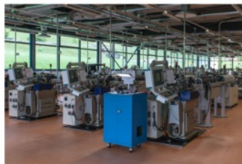
ネジ・スクリューの製造

バルミジャーニ・フルリエは、ヒゲゼンマイはもちろん、輪列を構成する歯車からケース、そしてダイヤルに至るまで、まさにビス1本からすべてを製造する稀少なメゾンです。