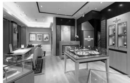
トアロード店2F パテック フィリップ・フロア

今年で創業110周年を迎えたカミネトアロード店2Fには、パテック フィリップの専用フロアが広がります。スイス本社の研修を修了した専任スタッフが、あらゆるご要望にお応えします。お気軽にお申し付けください。