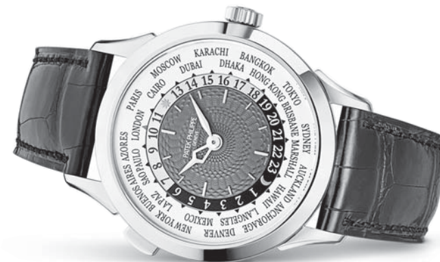
World Time Ref. 5230G

Discover the World of Patek Philippe at Kamine Torroad.