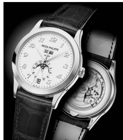
年次カレンダー 5396 RG(38.5mm) 自動巻 3気圧防水 ¥5,821,200(税込)