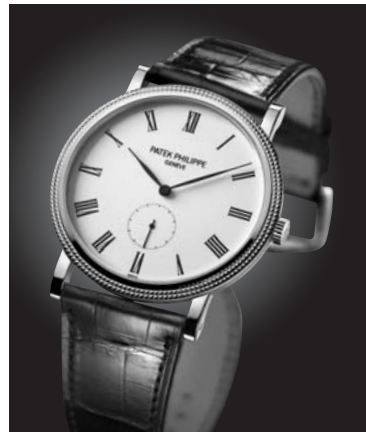
カラトラバ 5119 RG(36.0mm) 手巻き 3気圧防水 ¥2,613,600(税込)