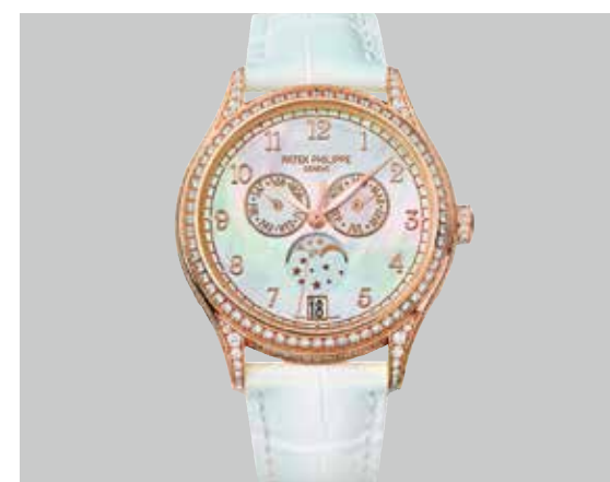
レディス・年次カレンダー 4948 RG(38.0mm) 自動巻 3気圧防水 ¥8,532,000(税込)