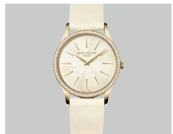
レディス・カラトラバ 4897 RG(33.0mm) 手巻き 3気圧防水 ¥3,488,400(税込)