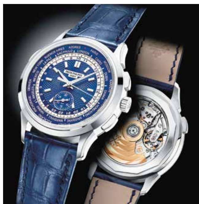
ワールドタイム・クロノグラフ 5930 WG(39.5mm) 自動巻 3気圧防水 ¥8,942,400(税込)