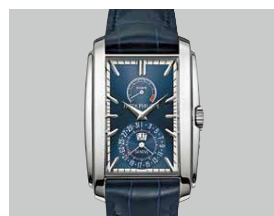
ゴンドーロ 5200 WG(46.9×32.4mm) 手巻き 3気圧防水 ¥6,706,800(税込)

伝統に培われて進化を続ける最高級ブランド パテック フィリップの豊富なコレクションをご覧ください。