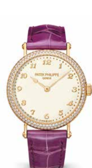
レディス・カラトラバ 7200/200 RG(34.6mm) 自動巻 3気圧防水 ¥4,816,800(税込)