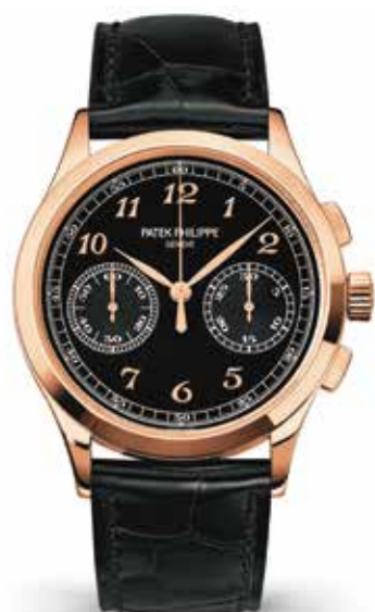
クロノグラフ 5170 RG(39.4mm) 手巻き 3気圧防水 ¥9,838,800(税込)