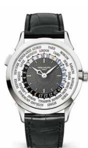
ワールドタイム 5230 WG(38.5mm) 自動巻 3気圧防水 ¥5,778,000(税込)