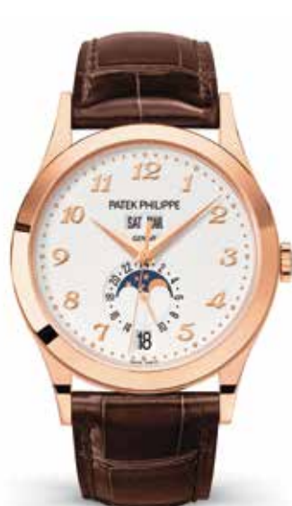
年次カレンダー 5396 RG(38.5mm) 自動巻 3気圧防水 ¥5,821,200(税込)