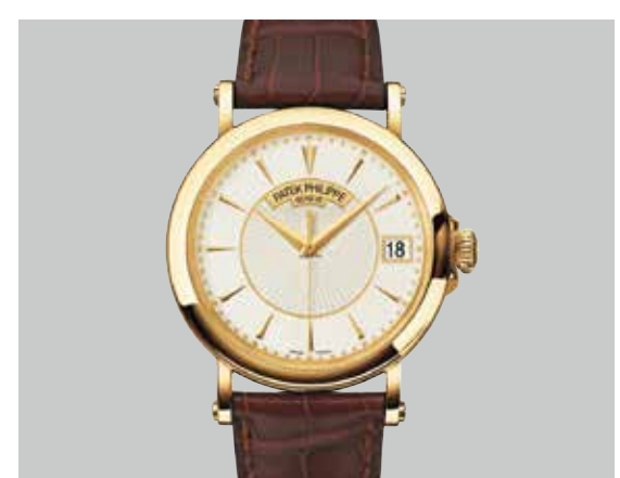
カラトラバ 5153 RG(38.0mm) 自動巻 3気圧防水 ¥4,201,200(税込)