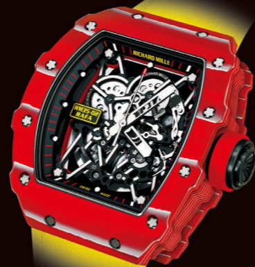
RM 35-02 オートマティック・ラファエル ナダル レッドTPTRクォーツ×TPTRクォーツ イエローケブラー/ベルクロストラップ 自動巻 スケルトンムーブメント ¥14,796,000 (税込)