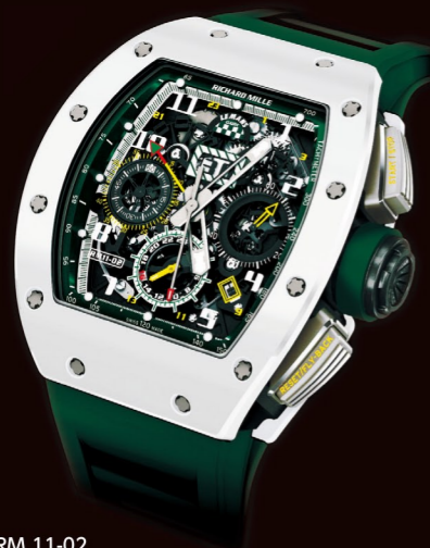
RM 11-02 ル・マン・クラシック NTPTカーボン/ATZホワイトセラミックス フライバッククロノグラフ・アナニアルカレンダー・GMT搭載 世界150本限定 ¥19,656,000 (税込)